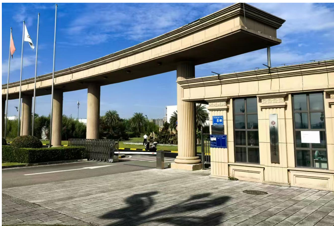
图 4 现场张贴公示公告照片